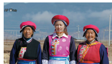
脸部识别自动对焦 (AF)

此功能特别适用于要求更高的 4K 拍摄应用，例如记录采访或演讲，帮助对特定目标人物自动保持聚焦点。